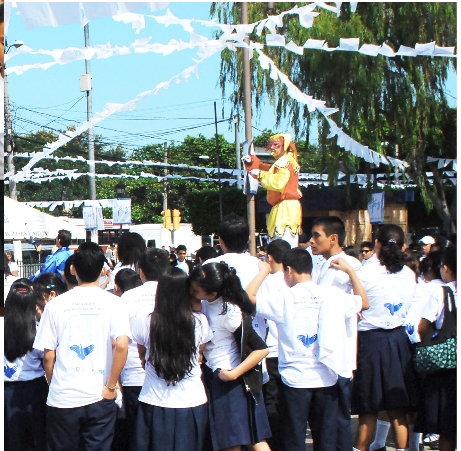
Asistentes al lanzamiento de campaña observan una de las diversas actividades realizadas.

En la primera fase de la campaña se realizó el evento de lanzamiento, actividades de interacción con la población, feria de paz y pauta publicitaria, a través de medios de comunicación masivos y en los espacios públicos.