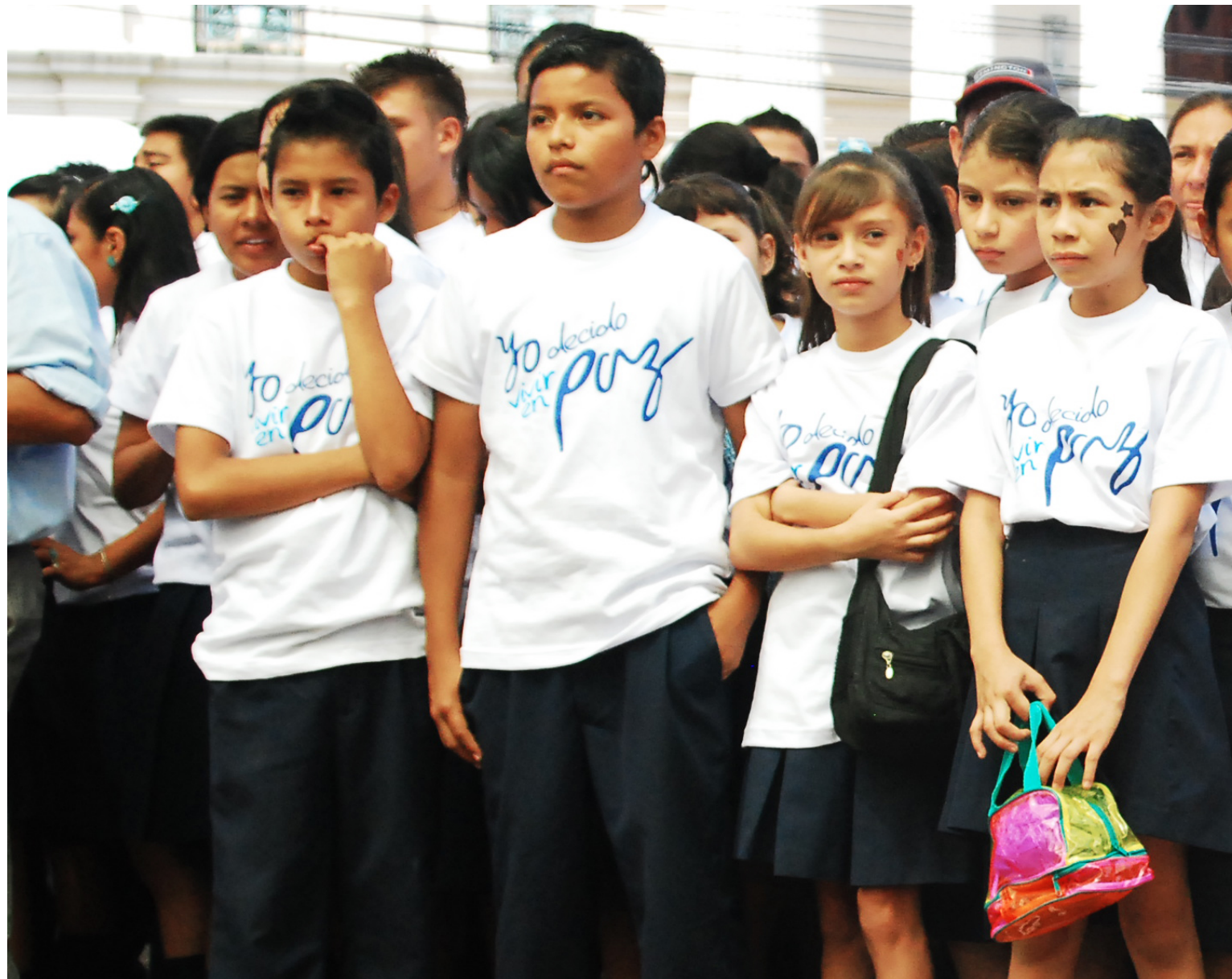
Niños y niñas asistentes al lanzamiento de la campaña.

El concepto de la campaña y sus estrategias de difusión son el resultado del trabajo articulado entre sus diferentes actores, quienes acordaron usar un lenguaje y un lema positivo para involucrar activamente a la población en la construcción de una nueva forma de relacionarse.