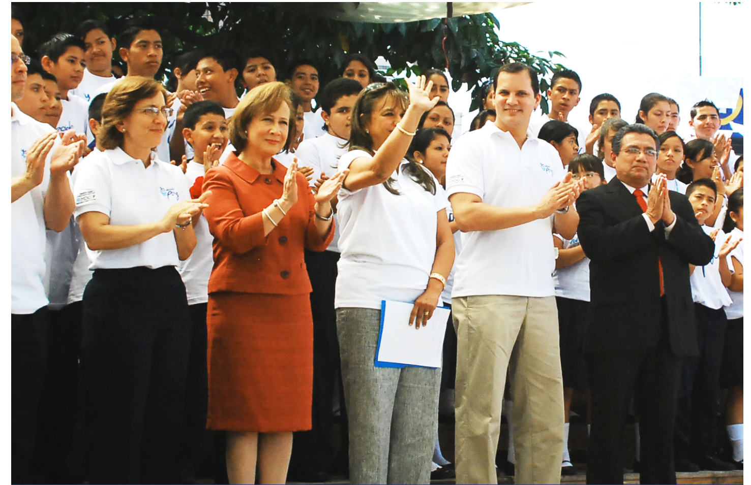
Representantes y funcionarios de las instituciones asociadas al Programa formaron la mesa de honor en el lanzamiento de la campaña. Entre ellos y ellas: Licda. Gloria de Oñate, en representación de la Alcaldía Municipal de San Salvador; Lic. Manuel Melgar, Ministro de Justicia y Seguridad Pública; Licda. Aída Santos de Escobar, Presidenta del Consejo Nacional de Seguridad Pública y Sra. Verónica Simán, en representación de las cinco agencias del Sistema de Naciones Unidas involucradas en el programa.